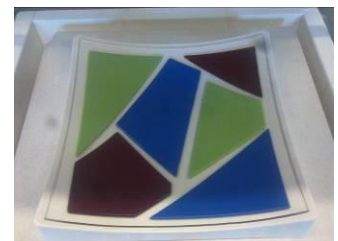
Glas op glas (zelf glas snijden)

Na het maken van het ontwerp (of het uitkiezen van een ontwerp) zal het fusen in een aantal delen uitgevoerd worden: