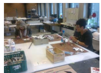
Eigen ontwerp maken