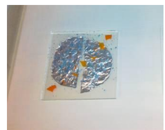
Fantasie met bijv. frit en folie