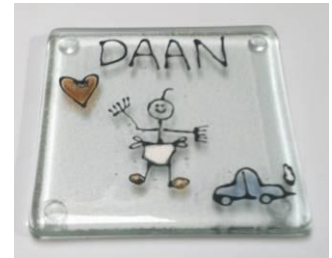
Geboorteonderzetter met naam