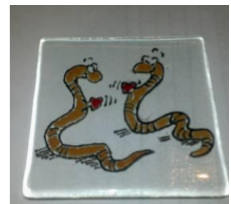
Nagetekend naar patroon