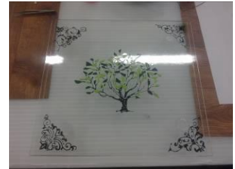
Glasmozaïek combinatie met glasverf