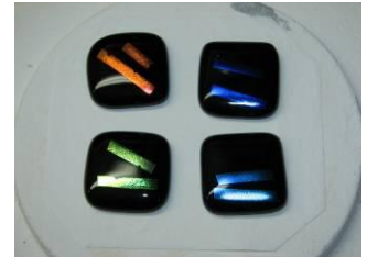
Zwart met dychroic glasreepjes