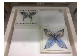
Beschilderen met glasverf