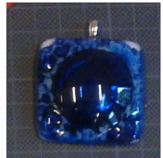
Belpoeder (gekleurde lichtbel)